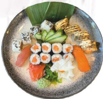
P3. Mix Petit 1,2,5,10,12 (18 p.) 19.00 €