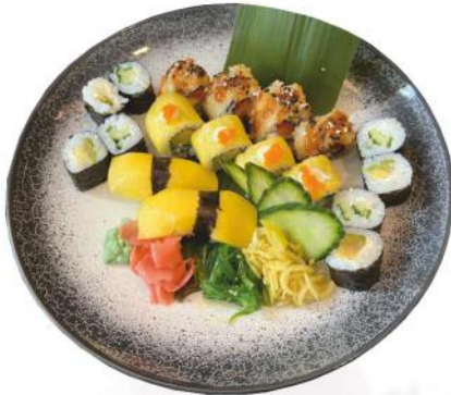
P1. Veggie 1,10,12 (20 pièces) 17.00 €